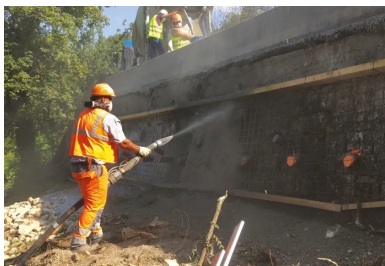
Réparation d'un parement par projection par voie sèche.

La quantité de pertes doit également être prise en compte pour ne pas excéder la capacité portante des échafaudages. Les pertes doivent être régulièrement évacuées de ces équipements (à minima à chaque changement de poste).