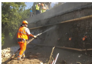
Réparation d'un parement par projection par voie sèche.

La quantité de pertes doit également être prise en compte pour ne pas excéder la capacité portante des échafaudages. Les pertes doivent être régulièrement évacuées de ces équipements (à minima à chaque changement de poste).