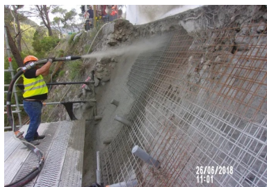
Confortement de talus par voie sèche.

Pour la maîtrise d'ouvrage et la maîtrise d'œuvre, cette certification les assure des compétences des opérateurs qui réaliseront le chantier et de la bonne qualité finale du travail. Elles sont en droit d'exiger une certification lors de tous travaux mettant en œuvre du béton projeté.