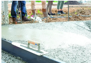
La talochage des premières planches d'essais s'est effectué manuellement, sans difficulté.

Chargée d'en concevoir le « paysage pionnier », l'agence Base a proposé une « approche naturaliste, inspirée des logiques et des mouvements des rivières dans cette zone, pendant des milliers d'années », explique Jeanne Souvent, paysagiste chez Base. Ainsi, la première parcelle végétalisée est conçue à la manière d'un « laboratoire d'expérimentations ». Ce lieu, baptisé Station Mue, est propice à l'imagination collective ; il fédère des initiatives populaires afin d'accompagner de nouveaux usages de l'espace public et de préfigurer la ville de demain.