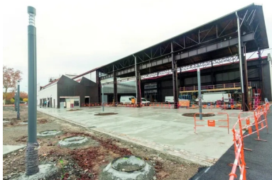
La première mise en œuvre du béton 100 % à base de granulats recyclés a été réalisée par Sols Confluence sur les abords de la nouvelle halle Girard, alias H7-Lyon French Tech. Elle a eu lieu à partir du 14 novembre 2018, en cinq jours de coulage, à raison de 20 à 30 m 3 quotidiens pour une équipe de 3 à 5 personnes, « directement à la toupette et au dumper »

« Il s'agit d'une première en France, concluent avec satisfaction Jeanne Souvent (agence Base), Nicolas Brasier (Vicat) et Sébastien Thiercé (Sols Confluence). Le nouveau quartier de Lyon Confluence est le lieu idéal pour mener ce type d'expérimentation et pour ouvrir la voie à un béton recyclé aisément utilisable en revêtement de sol, tout en gardant un caractère et une qualité esthétique indéniables. Nous sommes certains que c'est l'avenir ! »