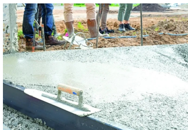
La talochage des premières planches d'essais s'est effectué manuellement, sans difficulté.

Chargée d'en concevoir le « paysage pionnier », l'agence Base a proposé une « approche naturaliste, inspirée des logiques et des mouvements des rivières dans cette zone, pendant des milliers d'années », explique Jeanne Souvent, paysagiste chez Base. Ainsi, la première parcelle végétalisée est conçue à la manière d'un « laboratoire d'expérimentations ». Ce lieu, baptisé Station Mue, est propice à l'imagination collective ; il fédère des initiatives populaires afin d'accompagner de nouveaux usages de l'espace public et de préfigurer la ville de demain.