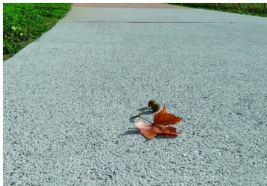
En juin 2018, les premières planches d'essais sont coulées à l'entrée du parc de la Station Mue. « Nous avons commencé par faire de petites planches, puis, de fil en aiguille, des planches de plus en plus grandes, poursuit Nicolas Brasier (Vicat). Finalement, nous avons atteint les objectifs : créer un nouveau béton à partir de rebuts de béton. »