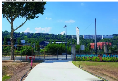
En juin 2018, les premières planches d'essais sont coulées à l'entrée du parc de la Station Mue. « Nous avons commencé par faire de petites planches, puis, de fil en aiguille, des planches de plus en plus grandes, poursuit Nicolas Brasier (Vicat). Finalement, nous avons atteint les objectifs : créer un nouveau béton à partir de rebuts de béton. »