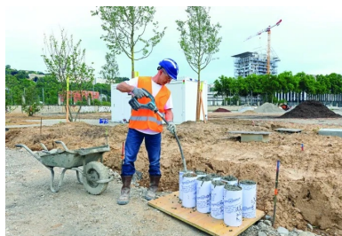
Préparation des tests de performances mécaniques et de tenue dans le temps