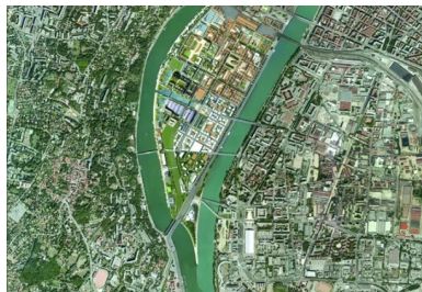
Le nouveau quartier Confluence se situe dans le prolongement du cœur de Lyon, derrière Perrache (III e arrondissement), entre Rhône et Saône.

Les chantiers de dépollution, menés à grande échelle, constituent également la marque du nouveau territoire. Pour la première phase des réalisations, pas moins de 250 000 tonnes de terre ont été extraites et dépolluées dans un centre de traitement. Choisi pour réaliser les espaces publics du Champ, le béton y joue un rôle bien spécifique, au diapason des exigences environnementales.