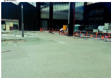
Le nouveau revêtement a une « apparence assez brute, de couleur grise, avec des agrégats roulés visibles, allant de l'ocre au noir. Il assure un bon confort de marche et une bonne adhérence. »

Maîtrise d'ouvrage : SPL Lyon Confluence - Maîtrise d'œuvre : Espaces publics du Champ : Base (paysagiste mandataire), Arcadis, Bruit du frigo, On, EODD ; Espaces publics du quartier du Marché : Atelier Ruelle, Artelia - Mise en œuvre du béton recyclé : Sols Confluence - Fournisseur du béton : Béton Vicat - Fournisseur des granulats : Granulats Vicat - Fournisseur du ciment : Ciment Vicat