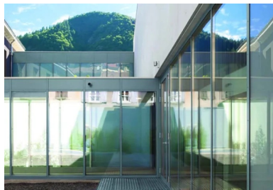
Un patio intérieur planté sépare le bâtiment existant de la nouvelle extension.

Le palais de justice de Digne-les-Bains occupe depuis le début du XIX e siècle le bâtiment des religieux Récollets, datant de 1603, qui devint bien national à la Révolution. Le nouveau tribunal de grande instance (TGI) inauguré à l'automne 2016 est le fruit d'un projet de restructuration et d'extension de ces locaux réalisés par l'agence Fradin Weck Architecture. « La conservation de l'ancien bâtiment et la création d'un bâtiment neuf à l'ouest, au bord de la place des Récollets, composent le nouveau TGI. Le dialogue entre l'ancien édifice et le nouveau forme un ensemble strict et homogène qui met en scène la présence de l'institution judiciaire.