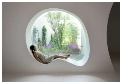
Fenêtre arrondie ouverte sur un jardin.

L'architecture de la grande salle existante, où sont situés les deux bassins, est préservée. La structure inclinée est mise en valeur et accompagnée par un jeu d'obliques qui apporte une touche contemporaine. La pataugeoire des petits offre un cocon où les enfants se sentent enveloppés. L'espace est courbe, atténuant naturellement la réverbération des sons. La grande baie en hauteur inonde de soleil le petit bassin arrondi. Ce lieu est conçu pour marquer l'imaginaire des enfants. La grande terrasse extérieure est traitée comme une plage. Ses garde-corps hauts assurent l'intimité des baigneurs.