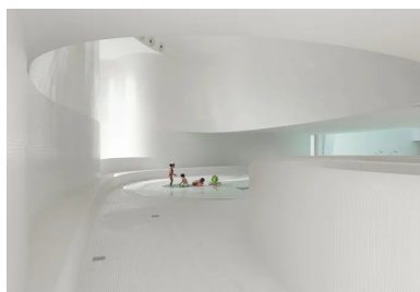
Vue sur la pataugeoire

Les parcours sont fluides, les courbes remplacent l'angle droit. L'espace de distribution est noyé dans une lumière aquatique étrange. Un hublot horizontal, au fond de la pataugeoire des petits, y diffuse une lumière bleutée qui ondule au gré de l'eau. Dans la salle de repos en double hauteur, les formes courbes englobent l'espace. Une belle fenêtre arrondie cadre sur un jardin.