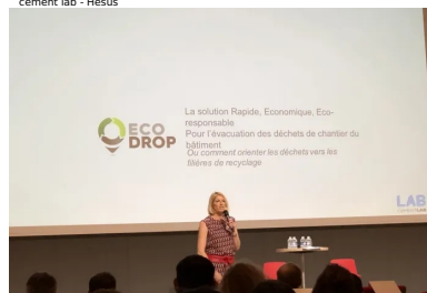
cement lab - Ecodrop