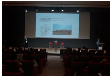
cement lab - vicat