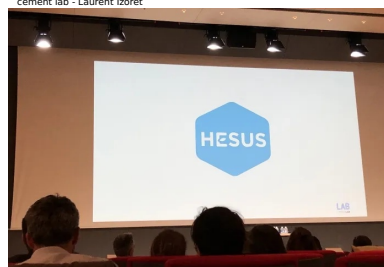
cement lab - Hesus