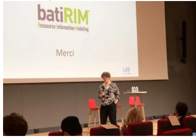
cement lab - BatiRim