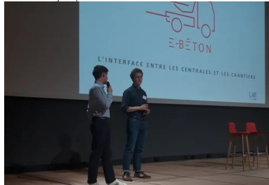
cement lab - E beton