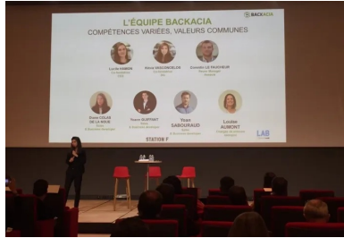
cement lab - backacia