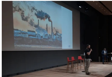
cement lab - water horizon