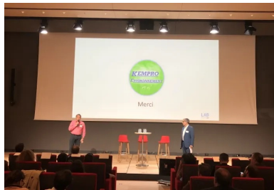
cement lab - Kemprow Environment