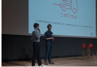
cement lab - E beton