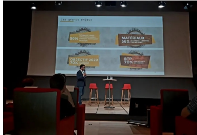
cement lab - cycle up