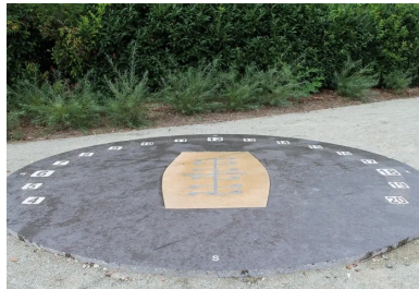
Ce cadran solaire analemmatique a été réalisé en béton chocolat et ton pierre avec des incrustations de sérigraphies métalliques.

passé. Evidemment, un tel chantier demande une véritable organisation. Pas question d'entamer des réalisations dans plusieurs endroits en même temps. Il faut pouvoir commencer et terminer une partie avant d'en entamer une autre.