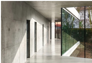
Le hall vitré sur le jardin dessert tous les vestiaires.

Pour répondre aux besoins de cet important équipement scolaire et des habitants du quartier, la ville de Strasbourg a décidé de construire un centre sportif. Son programme comprend une salle multisport et une salle polyvalente, pouvant accueillir des manifestations autres que sportives. À cela s'ajoutent des vestiaires, une infirmerie et un logement de fonction.