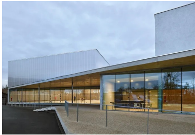
Vue depuis le parvis.

Son modèle pédagogique est fondé sur une approche multiculturelle, une ouverture très grande aux langues, ainsi que sur l'autonomie de l'enfant et une place importante laissée aux parents dans l'école.