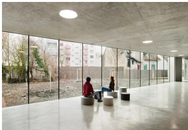
Le hall vitré sur le jardin dessert tous les vestiaires.

Conçu par l'agence d'architecture Dominique Coulon & associés, le centre sportif des Droits de l'homme établit un dialogue avec l'école européenne. « Notre projet prolonge la logique des fragments déjà mise en œuvre pour le bâtiment de l'école européenne. Les volumes des deux salles sont dissociés et pivotés, ce qui permet de placer la grande salle dans une situation idéale. Perpendiculaire à la rue et implantée en limite nord de la parcelle, sa position minimise l'impact du bâtiment dans le site. Toute la profondeur de la parcelle est utilisée, le bâtiment offre un linéaire plus court vers la rue, il donne plus de porosité vers le paysage. Le hall est transparent. Il laisse voir depuis le parvis le bois à l'arrière de la parcelle. Une couronne programmatique, accueillant les vestiaires et locaux annexes, entoure les deux salles, tout en ménageant des vues à la fois vers l'extérieur et entre elles », explique l'architecte Dominique Coulon.