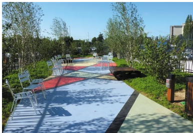
Cet espace de détente de 80 m2 en béton coloré et finement sablé arbore un arlequin rouge, noir, jaune et bleu en béton lissé, spatulé et gravé.

Couronné aux Victoires du Paysage, le jardin compte parmi les tout premiers de ce type en France.