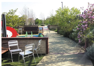
une allée centrale dessert l'ensemble du jardin pour finir dans une impasse.

Nous étions aux portes du centre hospitalier, ce qui imposait un taux de poussière égal à zéro ! Toutes les découpes ont été faites à l'eau. Nous avons également planifié les travaux pour ne pas faire de bruit durant les heures de traitement des malades. Il fallait canaliser le plus possible les nuisances. »