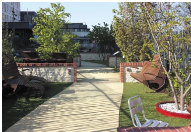
Le jardin est composé de plusieurs espaces délimités par des murets d'un mètre de hauteur, travaillés en pierre de Caen et en brique.