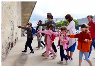
Dans le cadre de la visite guidée de la base sous-marine de Saint-Nazaire avec les enfants : le parcours sensoriel et ludique « Sensations béton ».