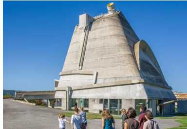
Eglise Saint-Pierre de Firminy (Conception : Le Corbusier, José Oubrenie).

De jeunes créateurs contemporains apportent aussi désormais leur touche personnelle. La ville, faisant sienne la remarque de l'architecte urbaniste Jacques Sbriglio selon lequel « la banalité d'une construction devient sa force d'expression », a en effet créé sa propre marque, « LGM BY », sous laquelle elle encourage des artistes et designers contemporains à proposer leur vision de la cité. Leur cahier des charges : produire des objets déco et art de vivre « tendance », en lien avec l'architecture de la cité balnéaire. C'est le cas chez Oxyo, par exemple.