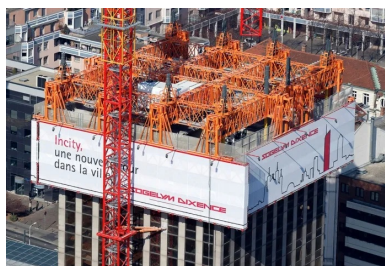
Déconstruction douce grâce à un système de protection qui descend au fur et à mesure de la démolition.

CB : Il fallait concevoir un système ingénieux pour combiner des contraintes de chantier concernant l'approvisionnement et le stockage. Pour cela, Bouygues a proposé la construction d'une plateforme surélevée au dessus de la rue Garibaldi. L'étroitesse du terrain nous a aussi conduit à développer une solution d'ascenseurs innovante qui permettait de réduire le nombre de cages d'ascenseurs pour gagner un maximum de surface destinée aux plateaux de bureaux.