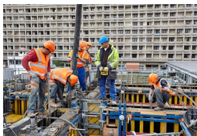
Déconstruction douce grâce à un système de protection qui descend au fur et à mesure de la démolition.

Pour la tête, la coiffe, nous avons mené plusieurs études. Nous souhaitions, au tout début, installer une éolienne, mais nous avons abandonné l'idée pour des questions de vibrations et de bruit. La tour est orientée avec trois façades respirantes en verre (Sud, Est et Ouest) qui intègrent des stores pour le traitement thermique et une façade Nord en simple peau (mais pas simple vitrage). La tête est orientée Nord-Sud dans le sens du vent, celui du Mistral qui démarre à Lyon pour aller vers le sud. Elle abrite l'ensemble des locaux techniques, de traitement d'air de la tour, largement ventilés, ouverts sur le toit pour préserver ainsi les voisins de toutes nuisances.