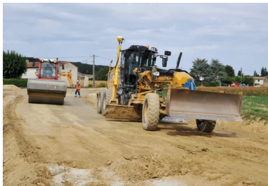
Derrière le malaxeur, la mise en œuvre se poursuit avec le nivellement de la chaussée (à droite) et le compactage du matériau (à gauche).