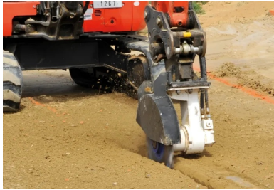
Le groupement E26-Guintoli a mis en œuvre deux systèmes de sciage, dont une dent crantée montée sur une pelle, intervenant systématiquement tous les quatre mètres pour canaliser les éventuelles fissures transversales...

Le chantier débute le 11 juin. Le lendemain, le 12 juin, l'atelier de traitement – avec l'ARC 1000 – est à pied d'œuvre. « L'ARC 1000 est une machine spécifique d'Eiffage Route pour les retraitements de chaussée, précise encore Jacques Ber. Sa particularité est d'assurer une homogénéité du matériau retraits comparable à celle d'une centrale fixe. Pour ce, l'ARC 1000 associe un rotor vertical équipé de 224 dents, un malaxeur longitudinal et une vis de répartition transversale. Ces dispositifs associés à une grande puissance et à une précision de dosage confèrent à l'ARC 1000 un coefficient HEPIL = 33333, gage d'une parfaite homogénéisation verticale et transversale de la couche retraitsée. »