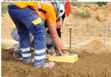
Vérification de l'humidification et de la densité réalisée à l'aide d'une jauge Humboldt HS-5001EZ.