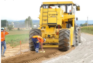
Et un autre mesure la teneur en eau du matériau traité.