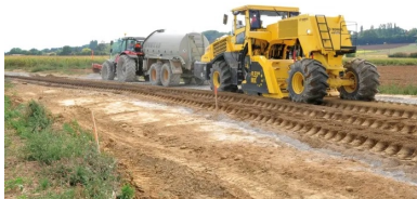
Derrière le malaxeur Bomag R5 650, un technicien vérifie visuellement l'homogénéité du mélange entre le matériau de l'ancienne chaussée et le liant hydraulique.

Cependant, au préalable, nous devons nous assurer de sa faisabilité. Nous avons donc procédé à une série de mesures : auscultations par mesures de déflexion, carottages et relevés des dégradations, puis diagnostic et modélisation de la structure avec les logiciels Erasmus et Alizé. Ceux-ci ont démontré la faisabilité d'un retraitement en place au liant hydraulique, notamment du point de vue des matériaux présents dans la chaussée – constituée d'une forte proportion de matériaux bitumineux sur 21 cm en moyenne (entre 15 et 31 cm) avec une couche sous-jacente en GNT – et de la portance envisageable », poursuit Frédéric Moralès.