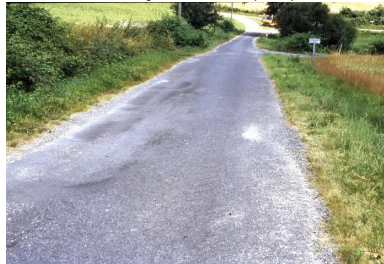
Vue générale d'une route dégradée structurellement