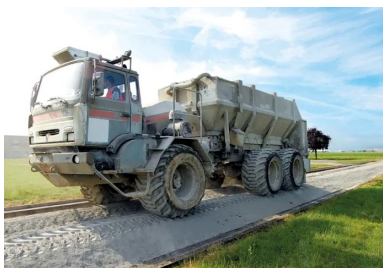
L'épandeur distribue avec précision le liant hydraulique.

Une couche de protection est ensuite appliquée sur la couche retraitée afin de la protéger des intempéries, de l'évaporation de l'eau et du trafic de chantier. Après durcissement de la couche traitée au liant hydraulique routier, une couche de surface à base de produit bitumineux est étendue afin de garantir la fonctionnalité de la chaussée.