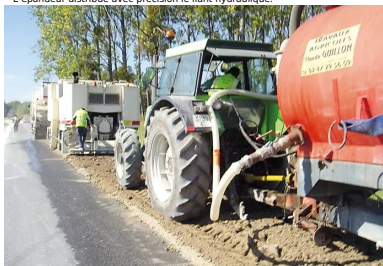
L'atelier de retraitement de chaussée réalise plusieurs opérations : fraissage, épandage et malaxage.