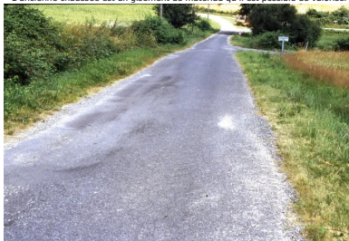
Vue générale d'une route dégradée structurellement