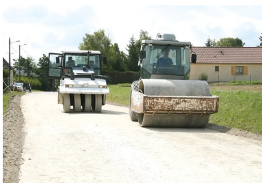
L'atelier de compactage.

Les chantiers réalisés en France, depuis une quinzaine d'années, se comportent de façon tout à fait satisfaisante grâce à la compétence de tous les acteurs : maîtres d'ouvrage, maîtres d'œuvre, entreprises et fournisseurs.