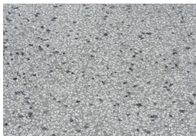
(En médaillon) Des granulats provenant de la carrière savoyarde de Grésy-sur-Aix ont été utilisés avec un mélange de basalte.

Au total, 2 700 m 2 ont été réalisés avec du 4/8 Grésy 90 % et du 6/10 basalte 10 % en ciment gris, dont 1 800 m 2 de béton bouchardé et 900 m 2 de béton sablé, et 550 m 2 en désactivé, avec du 8/20 Grésy 80 % et 10/14 basalte, 20 % en ciment gris. « Le béton provenait de la centrale Béton Vicat de Villaz (Haute-Savoie), située à proximité du chantier. Cette centrale est bien adaptée à la fabrication des bétons décoratifs grâce à ses nombreux cases », souligne Anthony Mayet de Béton Vicat Haute-Savoie.