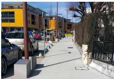
Les travaux se sont concentrés sur une zone de 400 m de long située sur la rue commerciale du bourg.

Au nord d'Annecy, Pringy est située sur l'ancienne route de Genève (ex-RD1201). On y accède par une longue avenue qui traverse également Annecy et Annecy-le-Vieux. À l'origine commune à part entière, la petite agglomération a fusionné au 1 er janvier 2017 avec les communes voisines d'Annecy, d'Annecy-le-Vieux, de Cran-Gevrier, de Meythet et de Seynod. Le nouvel ensemble constitue la commune nouvelle d'Annecy, qui compte désormais plus de 120 000 habitants.