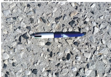
Le granulats 8/20 utilisé pour les places de stationnement s'incorpore aisément dans le béton et résiste bien à l'arrachement.