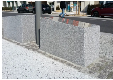
Le mélange de granulats Grésy avec une incorporation de basalte noir apporte un effet moucheté en surface, qui s'harmonise bien avec le granit, en créant un ensemble homogène.