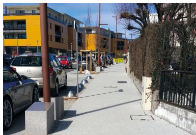
Les travaux se sont concentrés sur une zone de 400 m de long située sur la rue commerciale du bourg.

Au nord d'Annecy, Pringy est située sur l'ancienne route de Genève (ex-RD1201). On y accède par une longue avenue qui traverse également Annecy et Annecy-le-Vieux. À l'origine commune à part entière, la petite agglomération a fusionné au 1 er janvier 2017 avec les communes voisines d'Annecy, d'Annecy-le-Vieux, de Cran-Gevrier, de Meythet et de Seynod. Le nouvel ensemble constitue la commune nouvelle d'Annecy, qui compte désormais plus de 120 000 habitants.