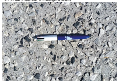
Le granulat 8/20 utilisé pour les places de stationnement s'incorpore aisément dans le béton et résiste bien à l'arrachement.