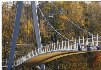
Le mât se confond dans la végétation.