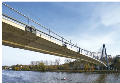
Le tablier en béton franchit l'Oise en une seule travée de 80 m.

Le tablier est constitué de voissiors en béton préfabriqués sur site. Facilitant l'assemblage du tablier, la préfabrication à joints conjugués a permis un contrôle précis de la géométrie du tablier et de la qualité de surface du béton. Les éléments ont été positionnés par barge , levés par grue et reliés à des suspentes verticales provisoires afin d'éviter la compression du tablier pendant le montage. Une fois les suspentes réglées et la géométrie définitive atteinte, le tablier est rendu monolithique par clavage, activant le fonctionnement structurel en treillis entre le tablier béton, les suspentes diagonales et les câbles porteurs. L'ouvrage se prolonge de part et d'autre par deux rampes en pente douce. En rive droite, la rampe « urbaine » emprunte le même vocabulaire que le tablier, créant un long ruban de béton qui s'étire sur presque 200 m. Portée par de fins potelets, elle couvre une partie de la place Fichet et sert de préau aux élèves de la nouvelle école Danièle Mitterrand... Sur les deux ouvrages en béton, la matière est restée telle quelle, sans parement ni étanchéité .