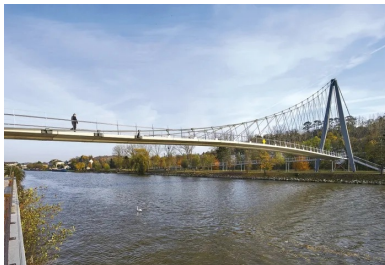
Pour ne pas gêner la navigation, l'ouvrage est suspendu.

Conçue par l'ingénieur-architecte Jean-François Blassel (SPAN) et les experts du bureau d'études RFR, la passerelle Nelson Mandela enjambe l'Oise sur 112 m. Dédicée aux piétons et aux cyclistes, cette « agrafe » entre ville et nature offre une esthétique délicate : la finesse d'un ruban de béton pour le tablier, un réseau arachnéen de suspentes , un mât en acier flanqué au milieu des arbres, des massifs d'ancrage en béton presque invisibles, des béquilles très discrètes, aucun impact dans la rivière, très peu dans le parc paysagé de l'île Saint-Maurice où les transparences sont préservées, et une aménité urbaine dans l'espace public du nouveau quartier. L'analyse du site révèle un contraste entre les deux berges : en rive gauche, le parc arboré de l'île Saint-Maurice s'adosse aux coteaux boisés qui mènent au plateau de Creil ; en rive droite, l'ancien quartier industriel de Gournay fait l'objet d'une rénovation urbaine pilotée par l'ANRU. Si l'asymétrie répond à cette dualité, la solution « suspendue » a été guidée par l'obligation de ne pas gêner le trafic fluvial.