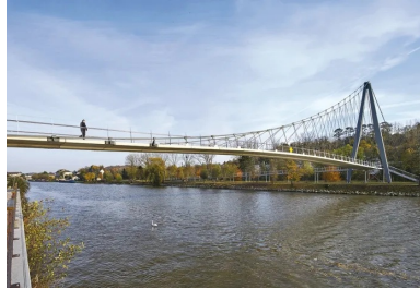
Pour ne pas gêner la navigation, l'ouvrage est suspendu.

Conçue par l'ingénieur-architecte Jean-François Blassel (SPAN) et les experts du bureau d'études RFR, la passerelle Nelson Mandela enjambe l'Oise sur 112 m. Dédiée aux piétons et aux cyclistes, cette « agrafe » entre ville et nature offre une esthétique délicate : la finesse d'un ruban de béton pour le tablier, un réseau arachnéen de suspentes , un mât en acier flanqué au milieu des arbres, des massifs d'ancrage en béton presque invisibles, des béquilles très discrètes, aucun impact dans la rivière, très peu dans le parc paysagé de l'île Saint-Maurice où les transparences sont préservées, et une aménité urbaine dans l'espace public du nouveau quartier. L'analyse du site révèle un contraste entre les deux berges : en rive gauche, le parc arboré de l'île Saint-Maurice s'adosse aux coteaux boisés qui mènent au plateau de Creil ; en rive droite, l'ancien quartier industriel de Gournay fait l'objet d'une rénovation urbaine pilotée par l'ANRU. Si l'asymétrie répond à cette dualité, la solution « suspendue » a été guidée par l'obligation de ne pas gêner le trafic fluvial.