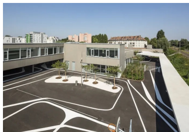
Les cours de récréation (ici, celle de l'école élémentaire) sont protégées des nuisances de voies ferrées par un mur écran.

Les circulations sont ponctuées d'arrivées de lumière naturelle et de vues sur la vie intérieure comme sur le monde extérieur, qui agrémentent les déplacements des enfants. Les éléments de structure du projet sont réalisés en béton coulé en place . Les panneaux en béton préfabriqué mis en œuvre, de type murs à coffrage et isolation intégrés, participent à la très bonne étanchéité à l'air de l'enveloppe du bâtiment, qui est conforme à la RT 2012.