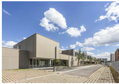
Le groupe scolaire et le gymnase s'inscrivent dans un bâtiment dont l'enveloppe dessine un écran fédérateur et qualifie l'espace public de la promenade.

À Lingolsheim, dans la périphérie de Strasbourg, le site de 13 hectares des anciennes usines des Tanneries de France accueille aujourd'hui l'écoquartier des Tanneries. Ce nouveau morceau de ville, à vocation essentiellement résidentielle, comprendra à terme 1 200 logements et accueillera, à l'horizon 2020, environ 3 000 habitants. Il est également pourvu d'un pôle d'équipements publics réunissant un groupe scolaire de 18 classes (maternelle et élémentaire), dont 2 classes d'accueil pour des enfants handicapés, un institut médico-éducatif (IME), un gymnase et une résidence seniors de 55 logements. Au-delà de la réponse apportée aux besoins des habitants, cet ensemble d'équipements publics constitue le cœur du quartier des Tanneries.