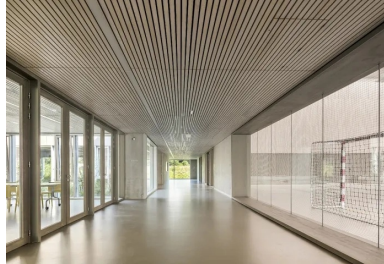
Les vues et les transparences donnent à voir les principaux lieux du gymnase.

Le groupe scolaire Simone Veil se développe sur toute la partie nord du site. Il comprend une maternelle de 6 classes et une école élémentaire de 12 classes. « Dans l'eurométropole, à l'école élémentaire, les enfants rentrent directement dans la cour et, de là, ils rejoignent leur classe. À la maternelle, chaque parent rentre avec son enfant dans le hall et l'accompagne jusque dans sa classe. Nous avons conservé ces deux modes de fonctionnement dans le projet. Le groupe scolaire dessine une figure en U encadrant le vide de la cour. Le volume du périscolaire vient séparer la cour de la maternelle de celle de l'école élémentaire. Le préau de cette dernière glisse sous le bâtiment pour chercher l'entrée et la promenade urbaine. Les salles de classe de la maternelle sont toutes dans le volume à rez-de-chaussée qui ferme la figure au nord. Celles de l'école élémentaire sont toutes au premier étage dans la partie sur rue », soulignent les architectes.