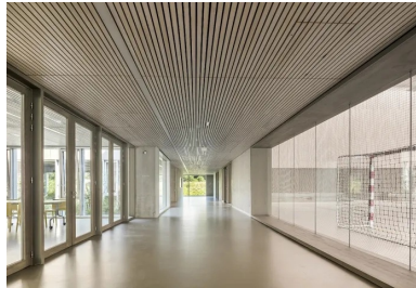
Les vues et les transparences donnent à voir les principaux lieux du gymnase.

Le groupe scolaire Simone Veil se développe sur toute la partie nord du site. Il comprend une maternelle de 6 classes et une école élémentaire de 12 classes. « Dans l'eumétropole, à l'école élémentaire, les enfants rentrent directement dans la cour et, de là, ils rejoignent leur classe. À la maternelle, chaque parent rentre avec son enfant dans le hall et l'accompagne jusque dans sa classe. Nous avons conservé ces deux modes de fonctionnement dans le projet. Le groupe scolaire dessine une figure en U encadrant le vide de la cour. Le volume du périscolaire vient séparer la cour de la maternelle de celle de l'école élémentaire. Le préau de cette dernière glisse sous le bâtiment pour chercher l'entrée et la promenade urbaine. Les salles de classe de la maternelle sont toutes dans le volume à rez-de-chaussée qui ferme la figure au nord. Celles de l'école élémentaire sont toutes au premier étage dans la partie sur rue », soulignent les architectes.