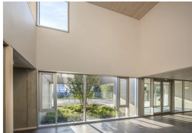
Dans le hall d'entrée de l'école maternelle, une fenêtre intérieure, à l'étage, crée un lien visuel avec l'école élémentaire.

Dans les espaces intérieurs, qu'il s'agisse des salles ou des circulations, on retrouve le béton brut , le bois clair en faux plafond et en revêtement mural. Un soin particulier apporté aux détails et aux usages, l'élégance des lignes composent une ambiance apaisante et rassurante. Dans toutes les salles, la qualité de la lumière naturelle participe au confort des enfants et leur offre des conditions sereines d'apprentissage. Des stores screen extérieurs permettent, si nécessaire, de se protéger du rayonnement solaire direct, pour éviter éblouissement ou réchauffement.