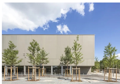
Vue sur le gymnase qui s'ouvre par une longue baie vitrée sur le square et le quartier.

Les architectes ont conçu un véritable bâtiment paysage, qui donne à voir et à être vu. Le bâti affiche sur la rue une alternance de pleins, de creux, de vides, de retraits, de transparences, qui rythment le volume global. Cela permet d'exprimer l'identité de chaque entité dans une enveloppe unificatrice, faite de panneaux en béton préfabriqué de type murs à coffrage et isolation intégrés, recouverts d'une lasure gris/vert. Cette enveloppe dessine un écran fédérateur et ordonné, qualifiant l'espace public.