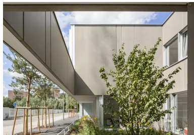
Un patio planté accompagne chaque entrée et la met en scène pour en faire une vraie adresse.