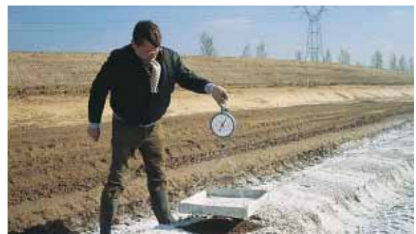
▲ Contrôle de l'épandage du liant.

La vérification de la régularité de l'épandage et de la quantité des liants est réalisée par la méthode dite "à la bêche".