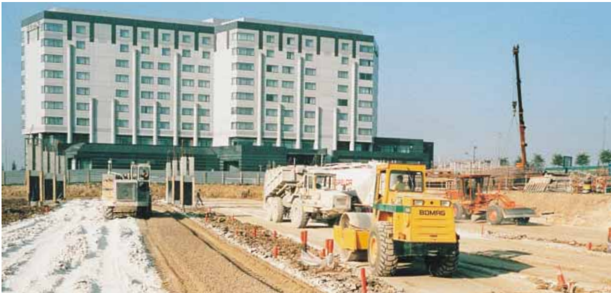
▲ Vue générale d'exécution d'une plate-forme industrielle. Assises en limon traité à la chaux et au ciment.

La raréfaction des ressources en granulats dans certaines régions et le renchérissement des transports ont incité maîtres d'œuvre, organismes techniques et entreprises à rechercher des solutions alternatives, notamment en faisant appel aux techniques permettant de valoriser les matériaux disponibles localement. Dans cette optique, le traitement des limons en place prend toute sa signification.