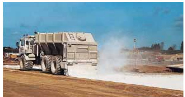
▲ Épandage du liant.

Pour réduire et maîtriser la dispersion du liant, il est préférable de retenir un épandeur à contrôle pondéral, asservi à la vitesse d'avancement.