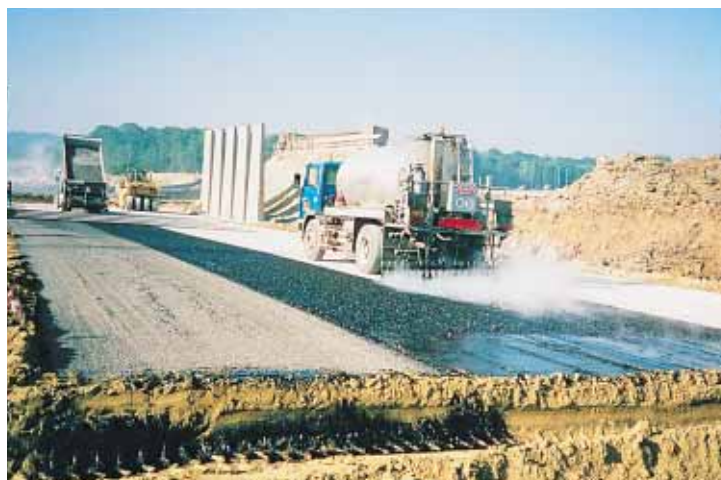
▲ Protection de l'assise de limon traité.