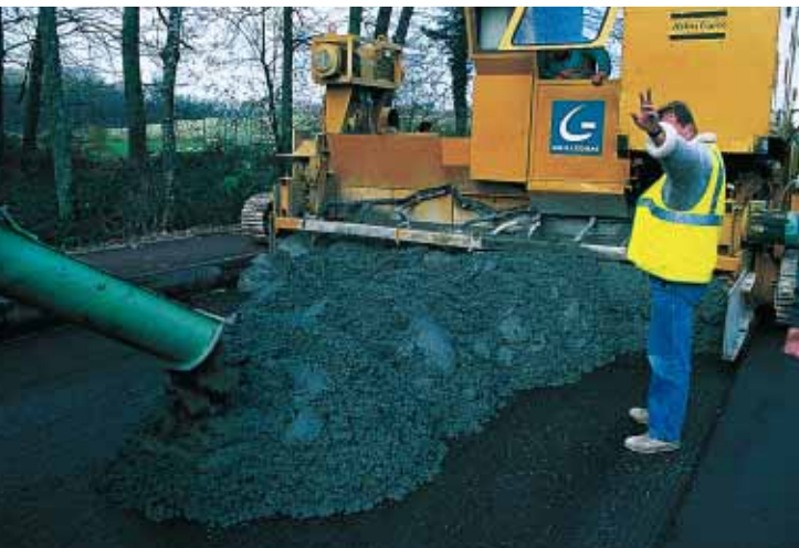
▲ Le béton est approvisionné par toupie devant la machine à coffrage glissant...