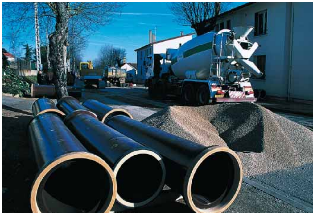
▲ Les services techniques de la ville d'Auxerre ont choisi la technique du BC Tranchées réexcavable pour un grand chantier d'assainissement.

Après avoir constaté des fuites sur une partie des canalisations d'assainissement, le conseil municipal de la ville d'Auxerre a décidé en juillet 1997 de remplacer le réseau unitaire (eaux usées et eaux pluviales) au niveau de l'avenue du Maréchal-de-Lattre-de-Tassigny et de la rue du 24-Août. "L'expérience nous a montré que le bon déroulement de ce type de chantier est souvent compromis par les aléas et les nuisances du compactage, constate Liliane Sadier, responsable des travaux sur les réseaux d'eau et d'assainissement de la ville d'Auxerre. D'une part, les riverains supportent difficilement le bruit, la poussière et les vibrations ; d'autre part, il est difficile de garantir une même qualité d'exécution sur tout le chantier." Conséquence : des tests doivent être menés régulièrement pendant le chantier pour s'assurer que la portance et la compacité requises sont atteintes. "Le compactage, c'est un peu notre bête noire, reconnaît Jean-Yves Abguillerm, qui dirige l'agence