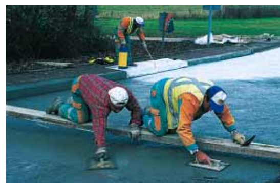
▲ Des retouches manuelles ont parfois été nécessaires.

La faible épaisseur des bétons mis en jeu permet de placer la technique à un niveau équivalent à celui des solutions courantes que sont la thermorégénération ou l'application d'une nouvelle couche d'enrobés. Avec un atout déterminant : l'assurance de ne plus avoir à répéter indéfiniment l'opération au fur et à me-