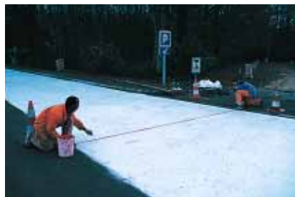
▲ La variation de la trame de sciage des joints de retrait a rendu délicates les opérations de marquage.

Absence d'entretien, coût de réalisation équivalent, remise en service rapide qui minimise la gêne occasionnée aux usagers, le BCMC devrait connaître un développement significatif en France, car il permet de répondre à une double préoccupation des maîtres d'ouvrage : réduire non seulement les investissements de départ, mais aussi les dépenses d'exploitation. En témoigne l'application de la technique à un carrefour très fréquenté à Memphis, aux États-Unis : "Le niveau de sollicitation était tellement élevé que l'enrobé devait être refait tous les 18 mois, constate Roland Dallemagne, directeur marketing chez Vicat. Le carrefour a été traité en BCMC il y a maintenant quatre ans. Depuis, aucune intervention n'a été nécessaire."