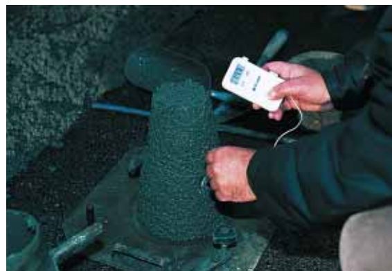
▲▼ La maîtrise de ce chantier expérimental a demandé des moyens de contrôle plus importants (prise de température du béton et réalisation de 18 éprouvettes au total).