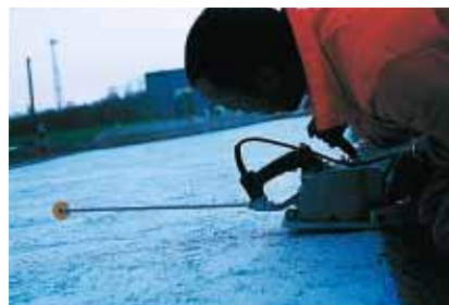
▲ L'opérateur s'apprête à réaliser le joint à l'aide d'une scie électrique de type "soft cut".

Comment ne pas être séduit par un remède durable à l'orniérage et à toute autre dégradation ? "Nos parkings pour poids lourds en enrobés sont régulièrement mis à mal par les fuites d'hydrocar-