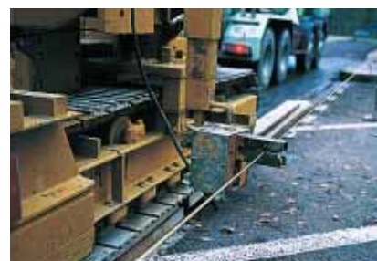
▲ Un capteur fournit à la machine une référence en altitude (guidage par fil latéral).

Réalisée le 26 novembre 1997, la plateforme en béton mince a été remise en service le lendemain, conformément au