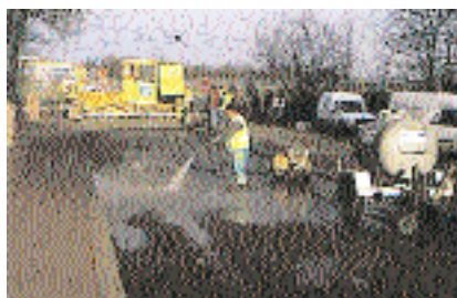
▲ La bonne adhérence du béton sur l'enrobé exige un nettoyage après rabotage de l'assise.

Seule la présence, en ce matin d'hiver sec et ensoleillé, de nombreux spécialistes des chaussées et de plusieurs représentants de la profession, trahissait le caractère exceptionnel de l'intervention menée sur l'aire des Châtaigniers, sur l'A6, en direction de la province, entre les sorties de Courtenay et de Joigny. Pourquoi porter tant d'intérêt à une opération en apparence ordinaire, le chantier consistant en l'application de béton désactivé sur une bande de stationnement de poids lourds de 615 m 2 ? "Nous nous trouvons