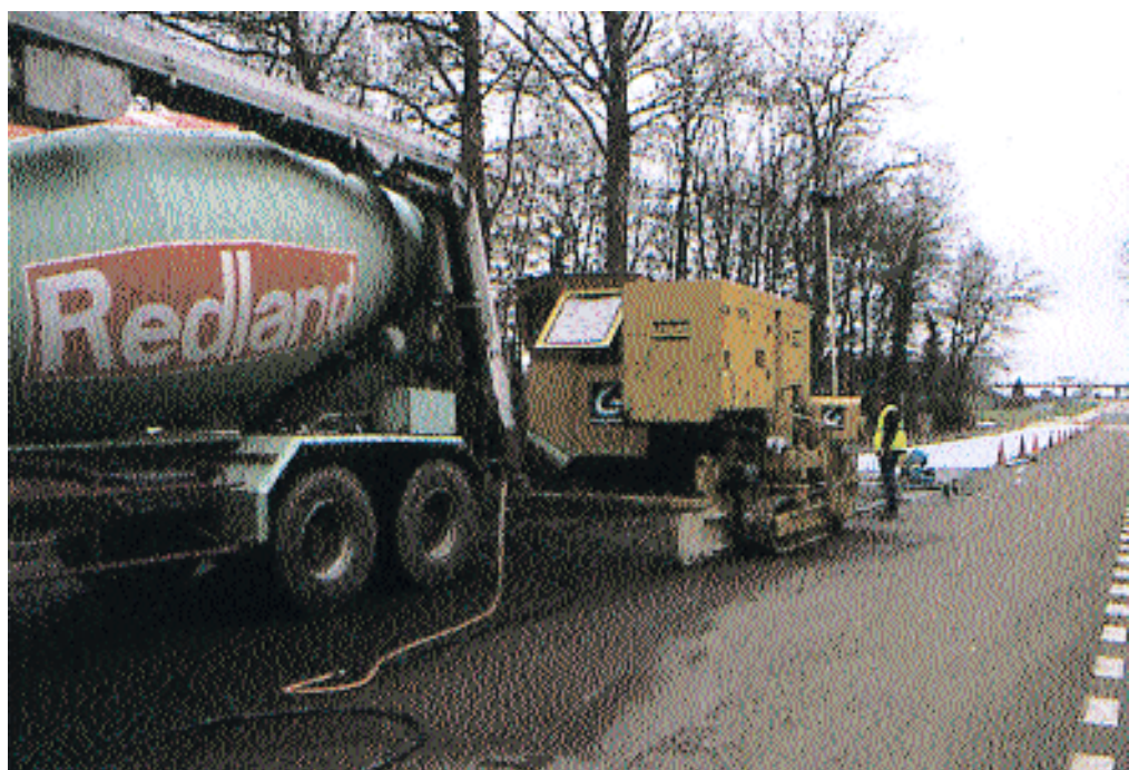
▲ Située sur l'autoroute A6 aux environs de Joigny, l'aire des Châtaigniers constitue la première référence en matière de béton de ciment mince collé (BCMC).