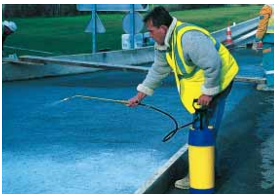
▲ Application du désactivant.