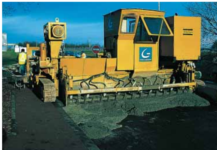
▲ ... qui traite une bande de 4,50 m de large en une passe.

la région Bourgogne chez Redland. Par ailleurs, les granulats ont été choisis pour leur grande résistance à l'usure, leur coefficient de polissage étant supérieur à 0,53." En outre, le béton est renforcé par des fibres polypropylène qui contribuent à réduire la microfissuration et la perméabilité, l'augmentation de la résistance aux chocs et à l'éclatement contribuant à améliorer sensiblement l'aspect des lèvres des joints à court terme et à long terme.