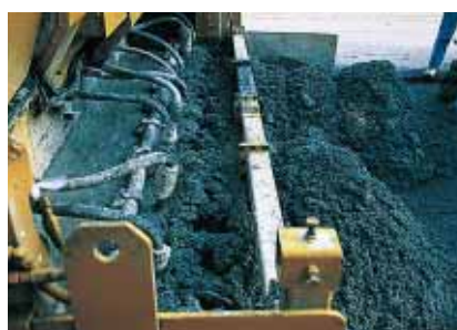
▲ La capacité de vibration de la machine à coffrage glissant est un paramètre important (vue des vibreurs).

latéral. Le caractère expérimental de l'opération a permis d'adapter légèrement la formulation après la première livraison, en modifiant les quantités de sable et d'eau pour faciliter la mise en œuvre, la machine ayant rencontré au départ quelques difficultés pour vibrer suffisamment le béton, insuffisamment maniable, ce qui a nécessité quelques interventions manuelles pour garantir une bonne régularité de la surface. Un agent désactivant, appliqué dans la foulée à l'aide d'un pulvérisateur, a permis d'inhiber la prise du béton en surface. Puis, quelques heures plus tard, on a procédé à un lavage à l'eau sous pression qui a permis de dégager légèrement les granulats. "Toutefois, la faible épaisseur du béton demande de diminuer la distance entre les traits de scie qui matérialisent les joints de retrait, souligne Ludovic Baroin.