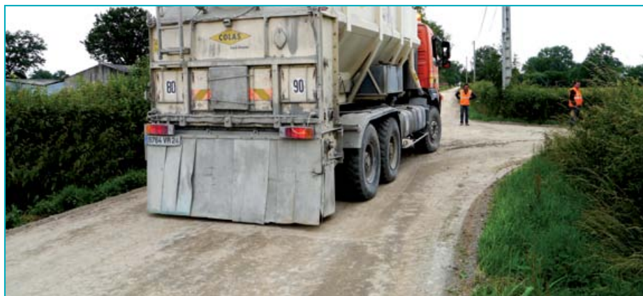
Le camion épandeur va servir à appliquer en surface, de façon régulière et uniforme, le liant hydraulique routier dosé à 4,5%.