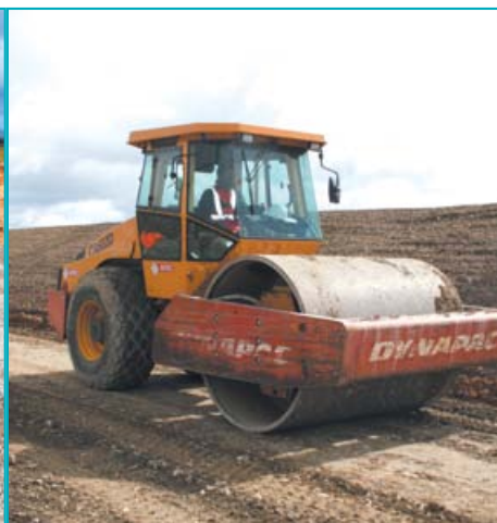
Deux phases successives de compactage suivent le passage de la niveleuse : à gauche, la première phase est réalisée avec un compacteur à pneus, à droite la seconde phase avec un compacteur vibrant.

« Pour plus d'efficacité, des camions de notre transporteur SATM, filiale de Vicat, étaient dédiés à ce chantier pour livrer les 1 100 tonnes nécessaires. Les chauffeurs connaissent bien le trajet, l'accès au site, sa configuration et la zone à livrer, ce qui évite de perdre un temps précieux. D'autant plus précieux qu'il y a trois heures de route depuis notre site de production et que le chantier démarre vers 7/8 heures » précise Cédric Jovin. Efficacité qui a permis à Setec de réaliser un traitement portant sur une superficie d'environ 22 000 m 2 en 12 jours seulement.