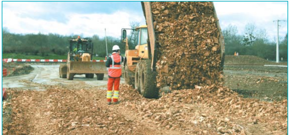
Déversement en surface des matériaux mis à nu par les terrassements.

« Comme il s'agit d'un terrain de plaine, le dénivelé ne dépasse pas les 2 à 3 %. Les mouvements de matériaux n'ont donc pas excédé une amplitude d'un mètre. Notre laboratoire « Grands travaux » a ensuite reproduit l'étude de pré-conception de TP Concept pour confirmer les dosages préconisés »