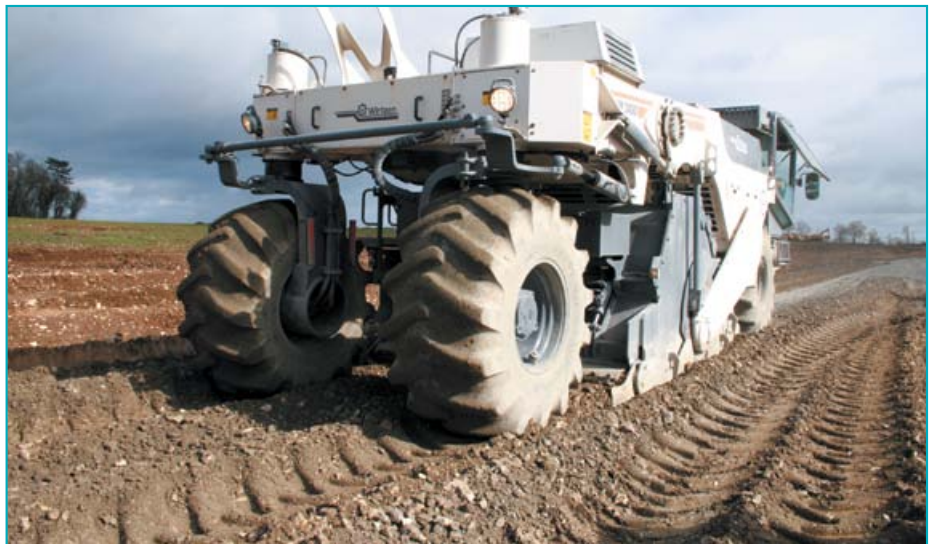
Phase de malaxage des matériaux mis à nu par les terrassements.

précise François Moreau, conducteur de travaux chez Setec.