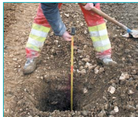
Un carottage permet de vérifier que la profondeur du traitement (40 cm) est bien conforme à ce qui était prévu.