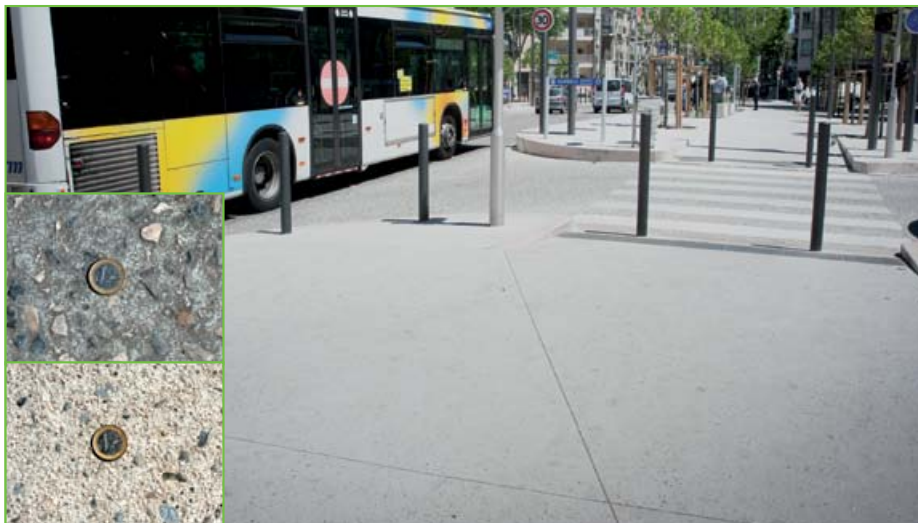
Marseille, place du 4 Septembre : la chaussée a été réalisée avec un béton désactivé à gros granulats pour supporter l'intense trafic des bus et leur stationnement. À ce béton, répond un béton hydrosablé, plus clair et plus fin sur les trottoirs, apportant du confort sous les pas des piétons.

« Cette place a une position centrale dans le quartier et elle est prévue pour que les habitants du quartier se l'approprient le plus rapidement possible » précise Caroline du Retail, responsable programmes de Marseille Aménagement.