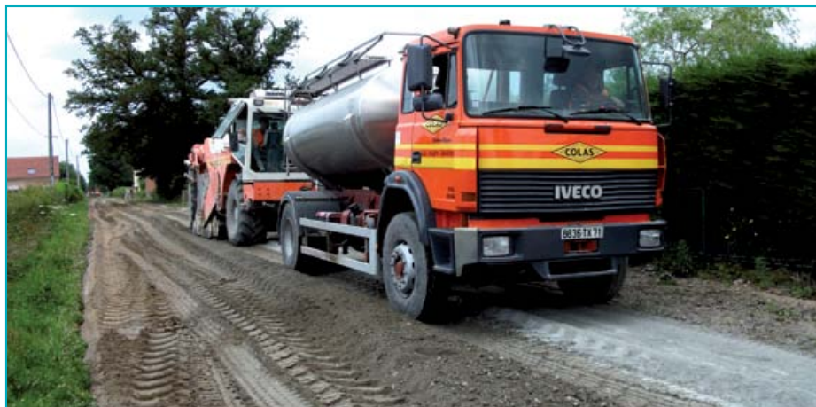
La première étape du retraitement consiste en une scarification, une fragmentation et un malaxage des matériaux de l'ancienne voirie.

il fallait prévoir un budget de l'ordre de 100 000 euros et deux semaines de travail avec la méthode traditionnelle. À cela s'ajoutait la circulation de nombreux poids lourds pour évacuer les gravats et acheminer les nouveaux matériaux : d'où d'importants risques de détérioration des autres voies communales, non dimensionnées pour ce type d'usage lourd. Sans oublier la gêne occasionnée aux riverains. On a donc privilégié la technique du retraitement des matériaux en place au liant hydraulique routier. Enfin, ultime avantage et non des moindres : cette technique revient de 30 à 40 % moins cher ! » résume Roch Dury.