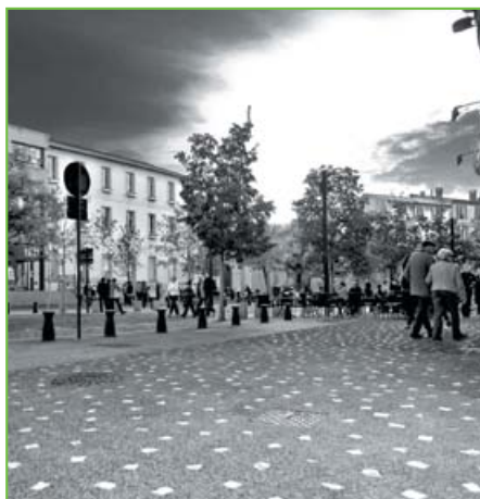
Gardanne : à la tombée de la nuit, les pavés calcaires incrustés dans le béton désactivé éclairent le sol sous le pas des piétons.

que les commerces trouvent un regain d'attractivité et puissent ainsi accueillir le marché les mercredi, vendredi et dimanche, et d'autre part agencer la circulation et permettre aux piétons d'avoir accès à de grands espaces. Nous avons donc vraiment tout revu de fond en comble, jusqu'aux modalités de stationnement qui, même s'il reste gratuit, est aujourd'hui limité à une heure dans cette zone ».