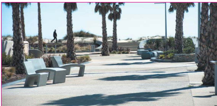
Le mobilier urbain en béton gris bleu possède un grain fin très doux qui offre un excellent confort et apporte une touche de modernité au béton désactivé.

béton gris bleu permettant aux piétons d'effectuer une halte ou de se reposer plus longuement. Ce mobilier urbain présente aussi l'avantage d'empêcher les voitures de stationner : certaines ayant, en effet, accès à la partie uniquement piétonne pour rejoindre les parkings des résidences riveraines, nous voulions absolument éviter le stationnement sauvage ».