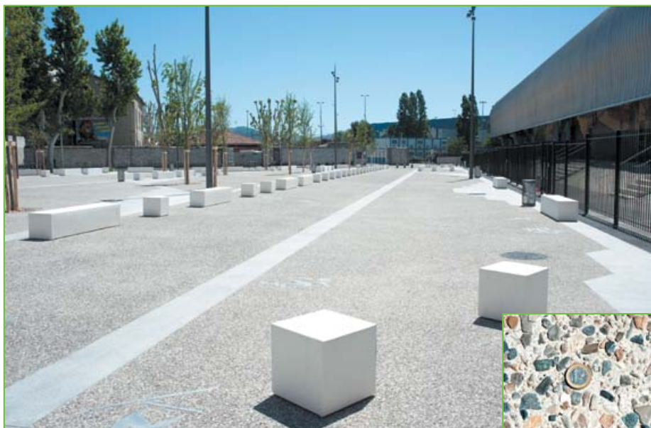
Marseille, place du Pomge : tout l'espace a été pensé pour qu'il soit approprié par les habitants du quartier. La place est rythmée par du mobilier contemporain en béton et des incrustations en inox ponctuent l'espace au sol.