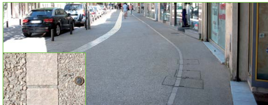
Salon-de-Provence : la clarté du matériau béton permet d'apporter de la luminosité, même dans les parties les moins ensoleillées des Cours. Deux bétons désactivés différents ont été mis en œuvre sur les trottoirs, pour permettre, notamment derrière le listel de pierre, de rattraper les écarts de niveau en façade des immeubles.

« Globalement, l'opinion de la population sur l'ensemble de ces travaux est très bonne » conclut Magali Brunel.