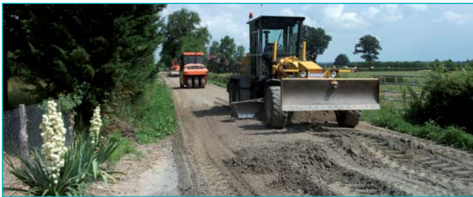
La niveleuse intervient juste après le passage du malaxeur et la phase de compactage suit le passage de la niveleuse.