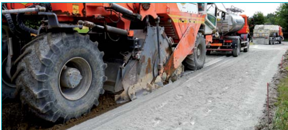
Après une passe de chaque côté, la troisième passe est centrale : elle permet de retraiter à nouveau une partie de chacune des deux couches précédentes, d'où une homogénéité finale encore meilleure.