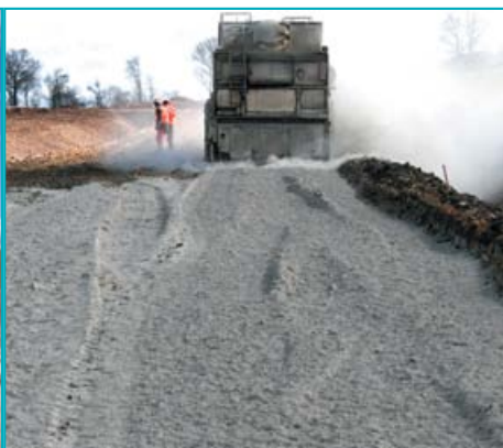
À gauche : épandage de la chaux, dosée à 1%. À droite : épandage du liant hydraulique routier, dosé à 7%.