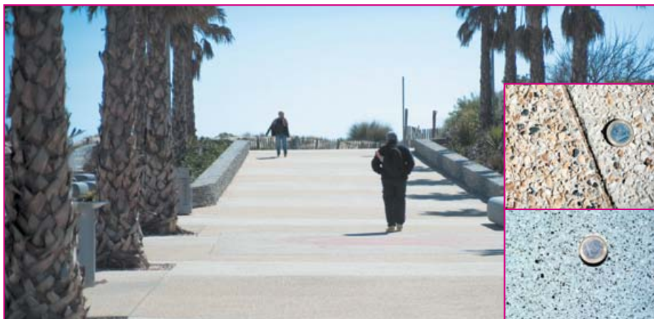
On distingue clairement les trois types de bétons désactivés, qui permettent de composer visuellement des vagues au sol.

Pour Pierre Mourey : « Nous avons voulu, à la fois, inciter les gens à aller vers la mer par cette avenue, mais aussi valoriser les commerces qui la bordent. Les piétons ont, en effet, gagné un large espace de déambulation, entre huit et neuf mètres selon les endroits. Puis, à quelques dizaines de mètres de la dune, l'espace est agrémenté de bancs en