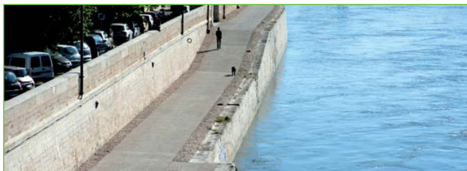
À terme, selon le projet de l'architecte Philippe Ghezzi, la chaussée en béton habillera l'ensemble des quais du Rhône et sera entièrement ouverte à la circulation des piétons et des vélos.

Trois types de granulats ont été mis en œuvre le long des quais, principalement un 6/16 de la carrière SCV (Vaucluse) combinés à un sable 0/4 de la carrière GSM de Beaucaire (Gard) liés par un ciment CEM II 42,5. Pour marquer la présence de l'histoire, une des parties les plus amples du quai, à Trinquetaille, il a