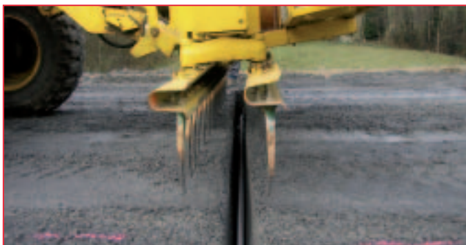
Insertion, dans le sillon, d'un joint en profilé plastique rigide, de forme sinusoïdale.