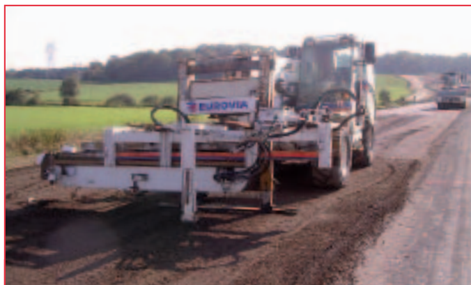
OLIVIA® : la machine de préfiissuration d'EUROVIA.

Ce matériel a été utilisé pour la réalisation de plusieurs chantiers, en particulier celui du terre-plein du port de la Goulette (Tunisie, 280 000 m 2 ). L'efficacité du procédé a poussé Viafrance à faire évoluer le matériel, de manière à intégrer plus facilement l'engin de coupe dans l'atelier de mise en œuvre. Un nouveau matériel, OLIVIA®, a ainsi vu le jour en 1992. Il permet l'introduction verticale d'un film plastique très