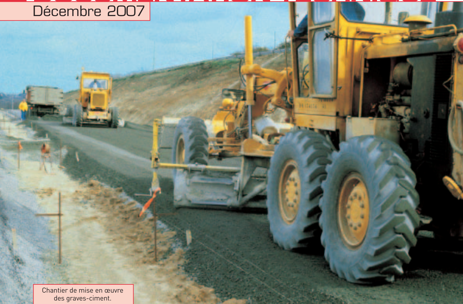
Chantier de mise en œuvre des graves-ciment.