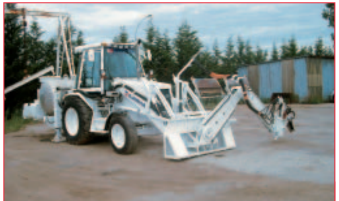
Procédé CRAFT® : le soc, porté par un bras télécommandé, permet d'ouvrir un sillon dans la grave-ciment.

Le procédé consiste à pratiquer un sillon, sur toute la hauteur de la couche, à l'aide d'un soc qui projette simultanément sur les parois du sillon une émulsion de bitume dont les caractéristiques (vitesse de rupture et pH) sont bien définies.