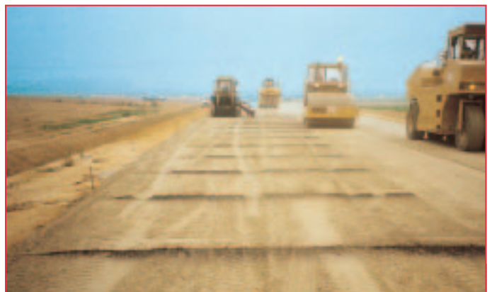
L'atelier de compactage suit la machine de préfissuration. Les joints exécutés sont espacés de 2 à 3 mètres.