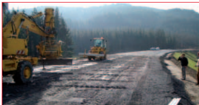
L'atelier de mise en œuvre des Joints Actifs®, procédé de fissuration des assises, mis au point par SACER.