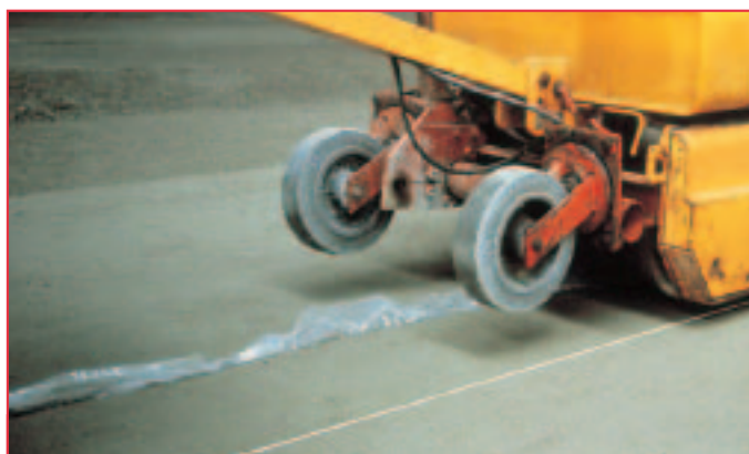
Machine à trancher les joints en position de travail. L'incorporation, dans le joint, d'une feuille de polyane permet d'éviter les épaufures aux bords de l'entaille.

mince (environ 80 µm) dans une couche de matériau traité, non compactée.