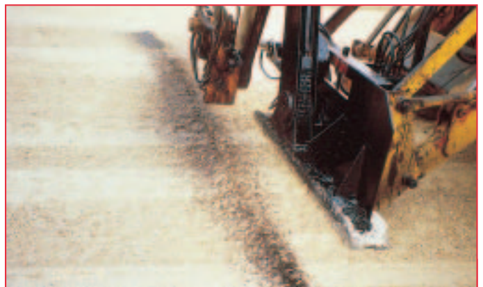
Procédé CRAFT® : le soc projette simultanément, sur les parois du sillon, une émulsion de bitume.