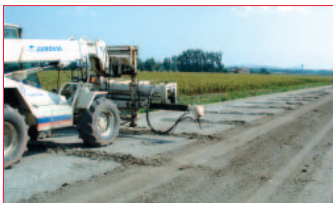
OLIVIA® en action : préfiissuration sur toute la largeur de la chaussée, élargissements compris.