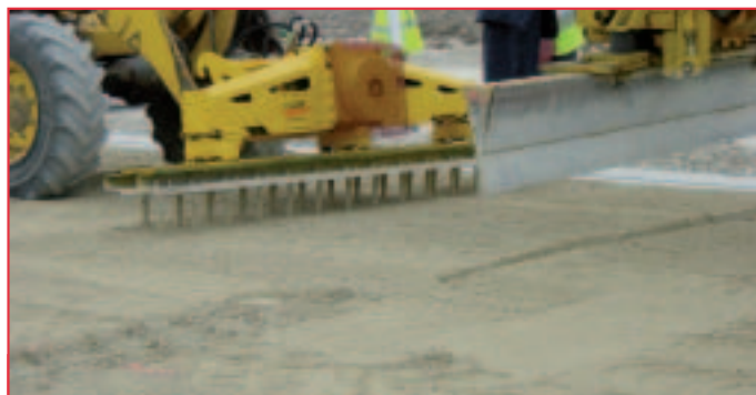
Création, par vibro-fonçage et avant compactage, d'un sillon transversal dans la couche de matériau traité.

Les profilés ont une épaisseur de 0,7 à 1,0 mm, une longueur maximale de 2,90 m et leur hauteur, modulable entre 16 et 24 cm, est fonction de l'épaisseur finale de l'assise (hauteur du joint inférieure à hauteur de l'assise). Deux types de profilés sont disponibles.