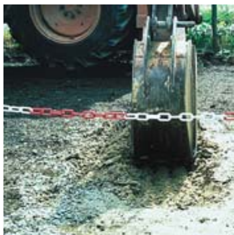
Tableau 1 : critères de réexcavabilité des matériaux autocompactants