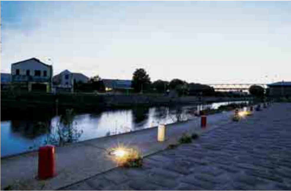
AMÉNAGEMENT DES BORDS DU CANAL, PROMENADE FLORALE – LA-PLAINE-SAINT-DENIS (93)