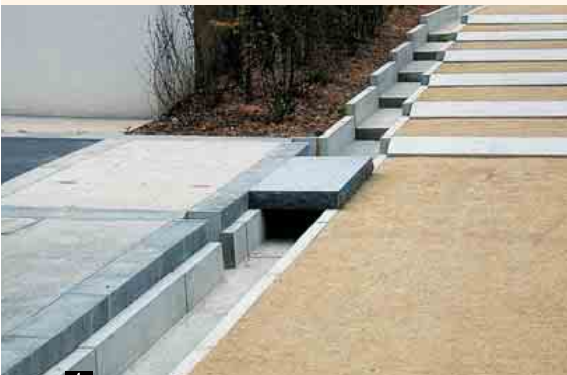
>>> 1 Des chemins d'eau en béton préfabriqué recueillent les eaux pluviales et structurent les quartiers d'habitat.

Les bétons coulés en place offrent eux aussi des solutions esthétiques multiples. Au-delà de leur rôle structurel, ils proposent de multiples finitions (balayés, sablés, désactivés, imprimés, bouchardés...) qui laissent une large palette de compositions et d'associations aux concepteurs. Souples dans leur mise en œuvre, ces produits présentent l'avantage de pouvoir être élaborés au coup par coup en fonction des projets et de leurs contraintes. En ce qui concerne les produits coulés en place, les possibilités de choix, tant au niveau des sables