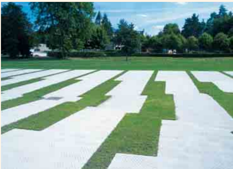
AIRE DE LOISIRS – BONNELLES (78)