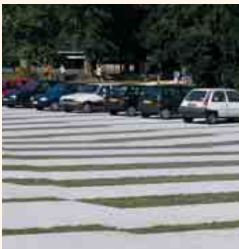
CIMETIÈRE DE BEAUSOLEIL – PACÉ (35)