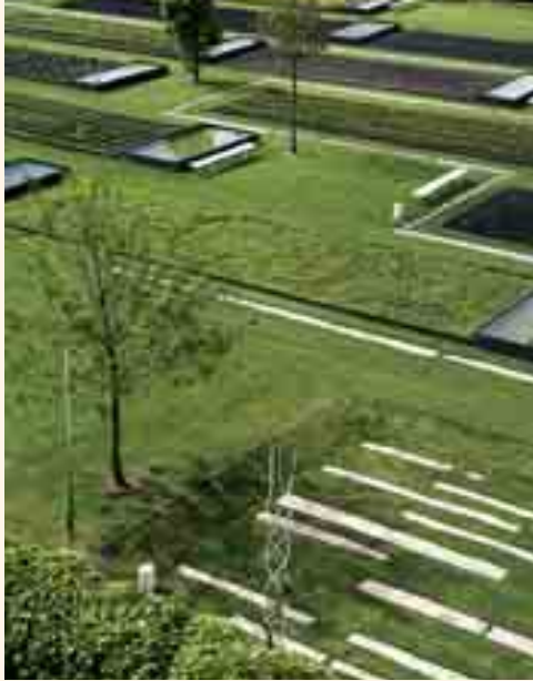
JARDIN BOTANIQUE, ALLÉE DES PLANTES – BORDEAUX (33)