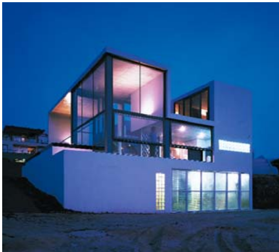
La maison de plage à Lima au Pérou

• La maison de la petite enfance de Torcy est le premier bâtiment où le mouvement continu de la matière est l'élément qui va déterminer de manière très précise comment le bâtiment va se représenter. Assez opaque à l'extérieur, il est très lumineux à l'intérieur.