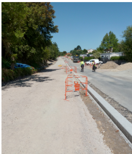
▲ Après les travaux préparatoires de la piste cyclable, la bordure en béton – séparant la piste cyclable/noue de la chaussée – a été coulée en place à l'aide d'une machine à coffrages glissants.