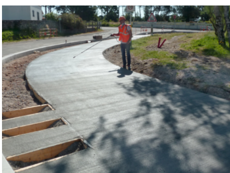
⤴ Pulvérisation du produit de cure.