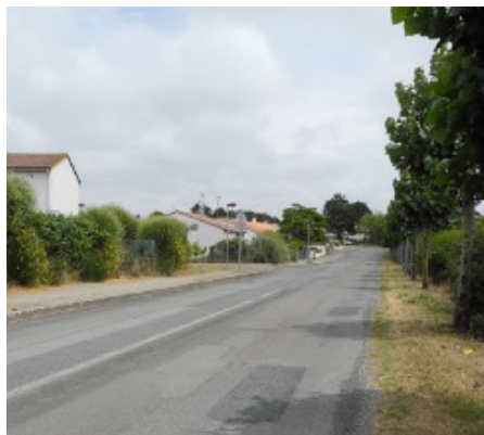
▲ L'avenue Gilbert-Burlot avant les travaux. On constate l'absence de piste cyclable sécurisée et l'état de dégradation structurelle de la chaussée.