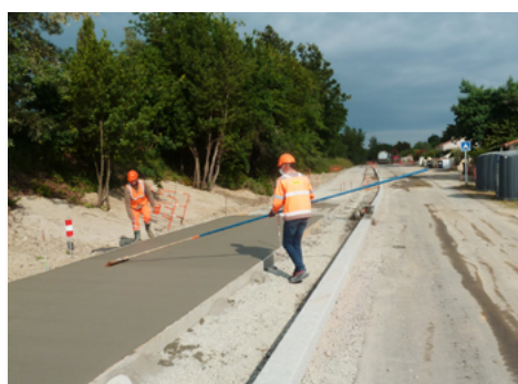
⤴ Balayage transversal du béton.