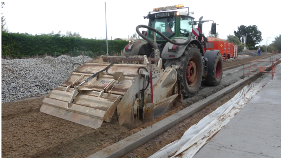
⤴ Après épandage du liant, le malaxeur mélange intimement le liant et les matériaux de l'ancienne chaussée.

Les trottoirs ont été réalisés avec des enrobés noirs, cloutés avec des matériaux calcaires 14/20.