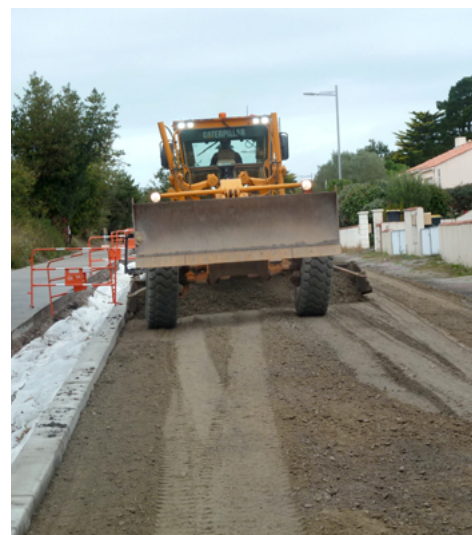
⤴ Réglage du matériau retraité à la niveleuse.