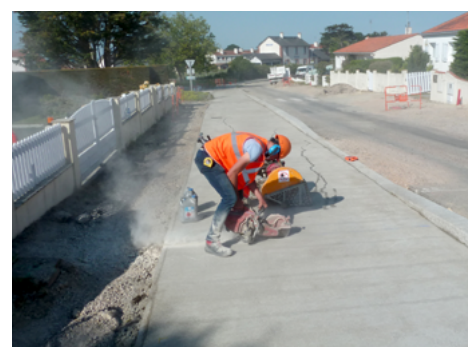
⤴ Exécution des joints de retrait par sciage.