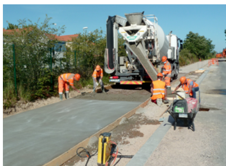
⤴ Coulage du béton.

Cette bonne vieille méthode, utilisée depuis la nuit des temps dans les pays chauds, a l'énorme avantage d'être corrélée positivement au développement : plus la démographie augmente, plus on construit, plus on augmente les surfaces réfléchissantes et plus on atténue l'effet de serre. Quand on sait ce que représentent aujourd'hui les surfaces développées des façades des bâtiments et les surfaces des infrastructures de transport, on mesure toute l'importance d'une telle approche. L'idéal, bien sûr, serait d'associer les deux voies.