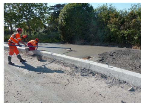
⤴ Talochage de la surface du béton.