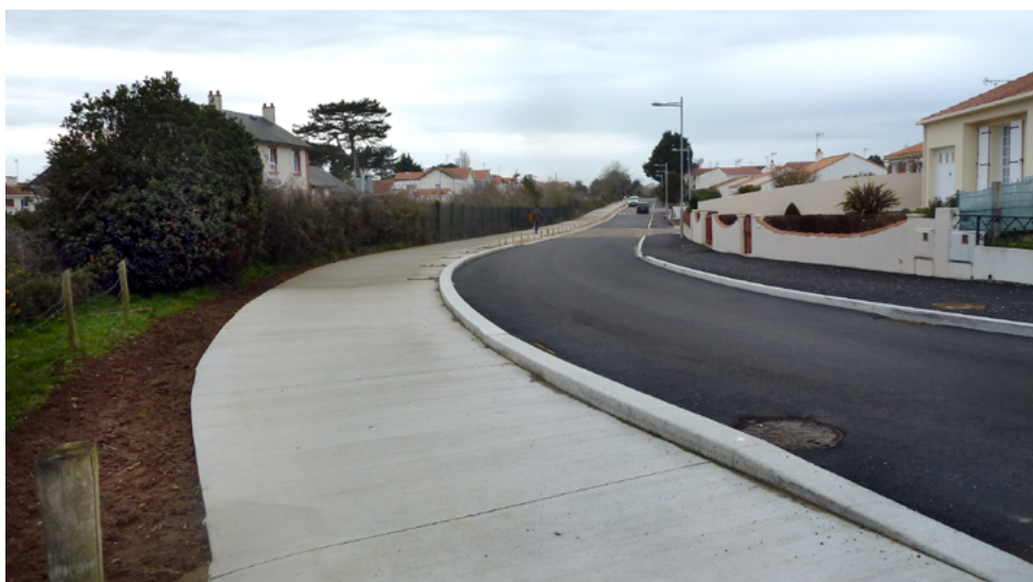
⤴ Vue de l'avenue Gilbert-Burlot avec le nouveau revêtement de chaussée.