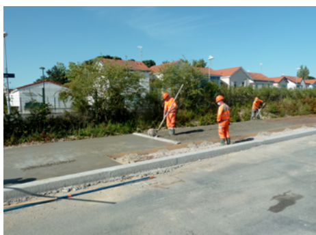
⤴ Vibration superficielle du béton.