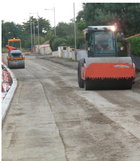
⤴ Atelier de compactage.